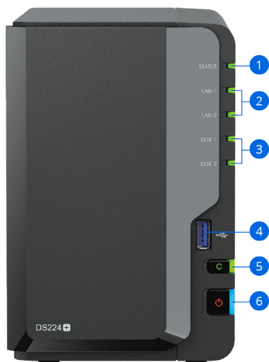
DS224+ (přední část)